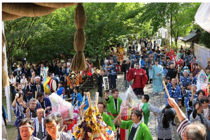
宮昇りと山の下木遣い