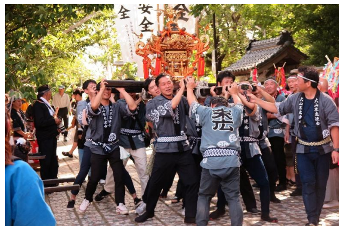
末広連合のお神輿