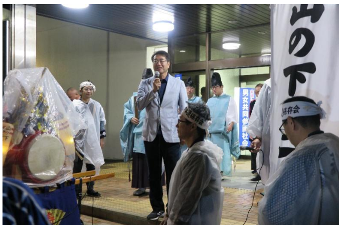
中原市長よりご挨拶