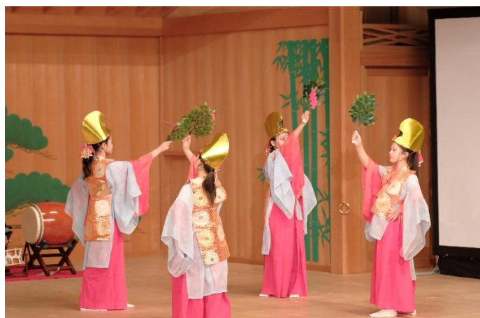
いっぴあ能楽堂で稚児舞を披露

各神社の御札・御守り・破魔矢・しめ縄は受付いたしますが、 神棚・ダルマ・人形・ぬいぐるみ・額縁等は受付できませんので、 ご協力をお願いします。