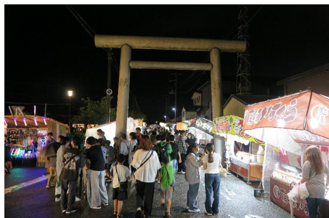
宵宮で賑わう露店