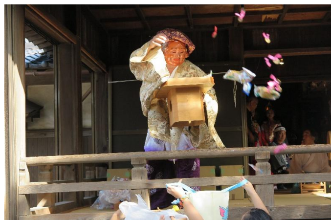
大黒さまのお菓子撒き