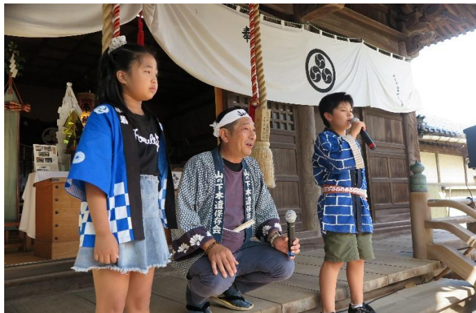
山小児童による山の下木遣い