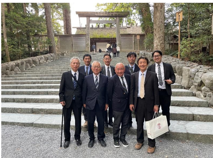
氏子総代会で伊勢神宮参拝